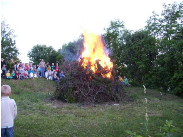
Skt. Hans på bålpladsen ved Skjoldhøjen.